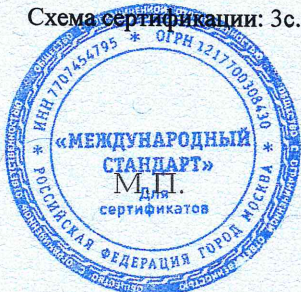
Схема сертификации: Зс.